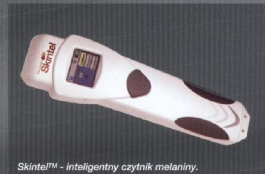
Skintel™ - inteligentny czytnik melaniny.

Vectus™, stosując wiele innowacyjnych rozwiązań konstrukcyjnych, jest najszybciej pracującym laserem w swojej kategorii. Dzięki zwiększonej końcówce zabiegowej pozwala wykonać zabieg depilacji dużych obszarów w zaledwie kilka minut.