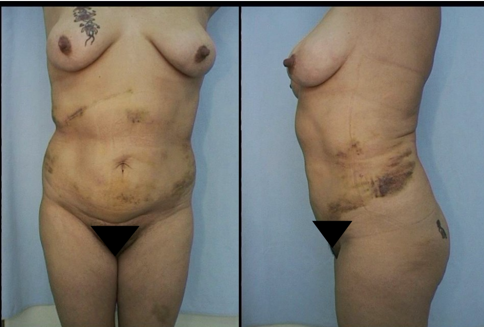
KONTROLA PPO ZABIEGU LIPOSUCTION W OKRESIE WCZESNYM

NADMIERNIE ROZWINIĘTA PODSKÓRNA TKANKA TŁUSZCZOWA ZNIEKSZTAŁCA PROPPORCJE CIAŁA, ZMUSZA DO AKROBACJI W DOBORZE GARDEROBY, A TAKŻE MOŻE BYĆ PRZYCYNĄ CHOROÓB OGÓLNOUSTROJO- WYCH